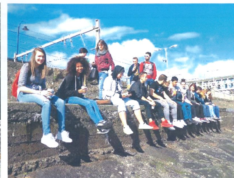
Figure 5) une pause sur le port de Dublin