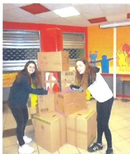
Figure 1) préparation des paquets cadeaux

Aussi, depuis quelques années, les classes de 4 ème et de 3 ème participent à l'animation du village pour le 8 décembre. En association avec les commerçants et les sous des écoles, les élèves préparent les décorations des rues du bourg avec une thématique renouvelée chaque année. Un quizz élaboré à partir des vitrines des commerçants permet aux jeunes écoliers des écoles maternelles et primaires de gagner des lots de bonbons offerts lors du marché de Noël du sous des écoles. Un petit bonus a été ajouté l'an dernier avec la photo offerte avec un animal pour les plus jeunes.