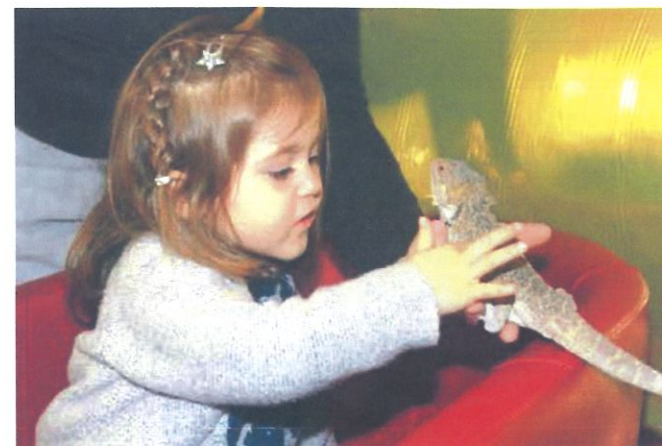
Figure 3) les plus jeunes poussés par la curiosité

Les petits sont également accueillis au sein de l'établissement avec la visite organisée de l'animalerie pédagogique pour les élèves des écoles maternelles du territoire (Villié-Morgon, Chiroubles, ...). Pris en charge par les jeunes de la classe de Seconde Vente animalerie, c'est l'occasion d'aller à la découverte d'animaux connus et moins connus, du lapin nain aux reptiles en passant par les oiseaux et les poissons. Les plus grands partagent ainsi leur passion du monde animal avec les plus petits.