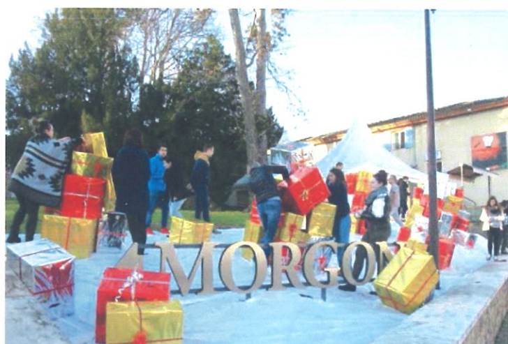
Figure 2) mise en place des paquets